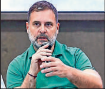
DMK mouthpiece said INDIA bloc parties' chiefs, including SP's Akhilesh Yadav & RJD's Tejashwi Yadav, expressed dissatisfaction over Cong's handling of allies

Questioning Congress leadership's approach towards allies, the DMK mouthpiece asked, "Isn't Congress ashamed to first weaken alliance partners and then seek their support when the need arises?"