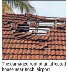
The damaged roof of an affected house near Kochi airport

"If a house owner is to seek compensation from an airline company, it will be a long and strenuous process. Moreover, the involvement