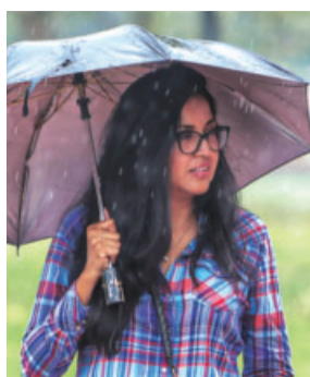
दिल्ली में बारिश से हवा साफ हुई

इस बीच, उच्चतम न्यायालय ने शुक्रवार को कहा कि पंजाब और दिल्ली से सटे कुछ अन्य राज्यों में पराली जलाने की घटनाएं रोकनी होंगी और राष्ट्रीय राजधानी क्षेत्र (एनसीआर) में प्रदूषण का स्तर कम करने के लिए समाधान खोजना होगा। न्यायमूर्ति संजय किशन कौल, न्यायमूर्ति सुधांशु धुलिया और न्यायमूर्ति अहसानुद्दीन अमानुल्लाह के पीठ ने दिल्ली-एनसीआर में खतरनाक वायु प्रदूषण से संबंधित एक मामले की सुनवाई