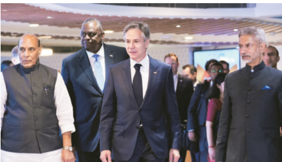
रक्षा मंत्री राजनाथ सिंह तथा रक्षा मंत्री लॉयड ऑस्टिन, विदेश मंत्री एंटीनी ब्लिंकन और एस जयशंकर

जयशंकर ने कहा कि दोनों पक्ष अहम प्रौद्योगिकियों, असैन्य बाह्य अंतरिक्ष क्षेत्र और महत्वपूर्ण खनिजों जैसे नए क्षेत्रों में सहयोग की संभावनाएं तलाश रहे हैं तथा स्थापित क्षेत्रों में अपने सहयोग को बढ़ा रहे हैं। उन्होंने जून में प्रधानमंत्री नरेंद्र मोदी की अमेरिका यात्रा और अमेरिकी राष्ट्रपति जो बाइडन के भारत आने का भी उल्लेख किया। जयशंकर ने कहा, 'इस वर्ष का मुख्य आकर्षण जून में प्रधानमंत्री (मोदी) की अमेरिका की राजकीय यात्रा थी, जिसने वास्तव में हमारे संबंधों में एक नया